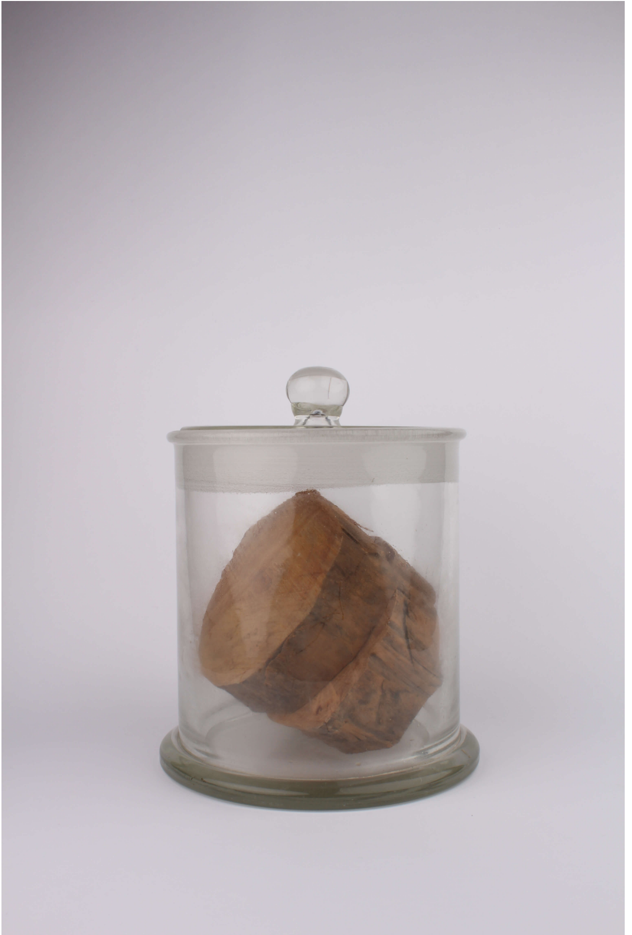
Fig. 1. Liquidambar orientalis - Lignum - FS 2760.