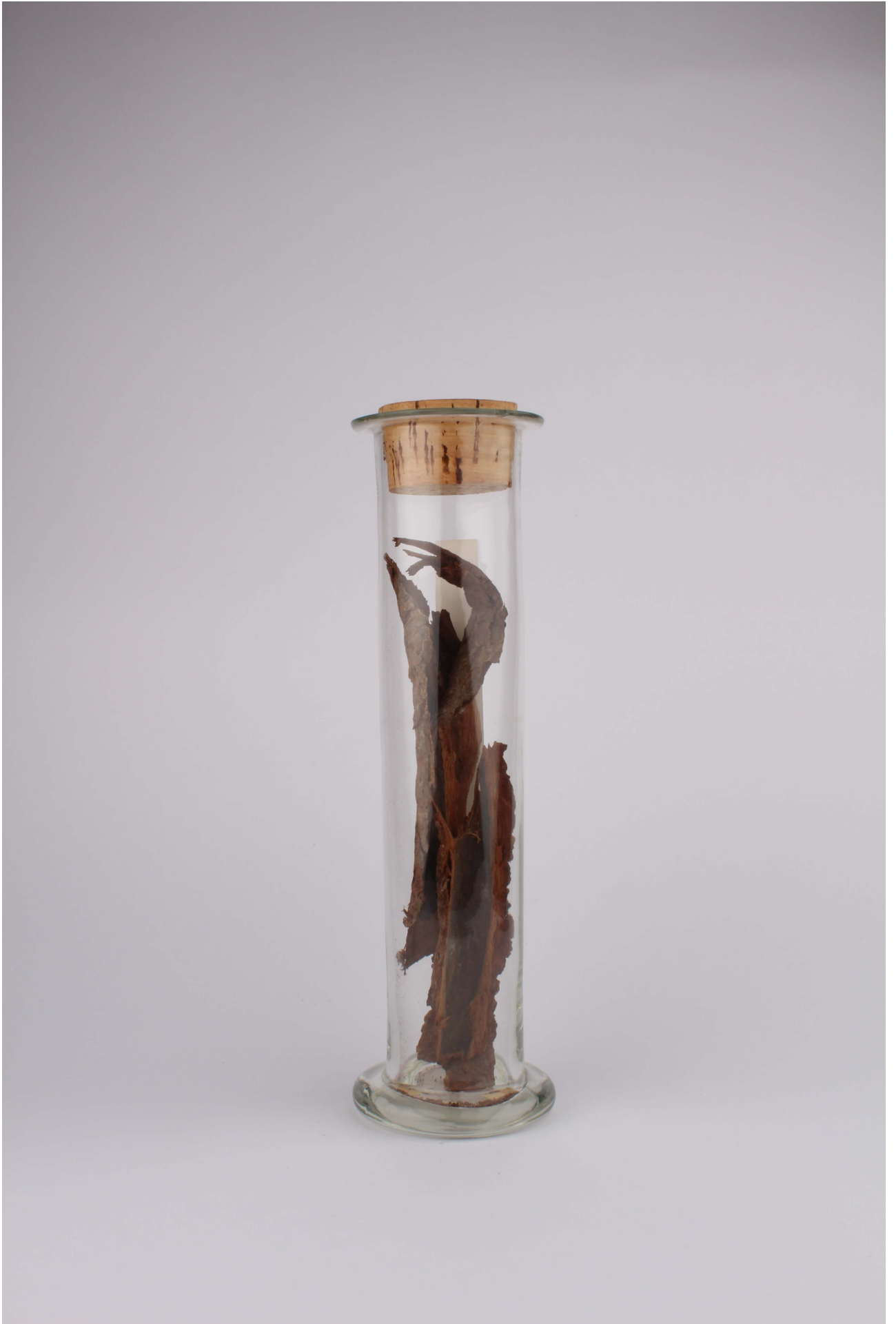
Fig. 2. Liquidambar orientalis - Lignum - FS 5624.