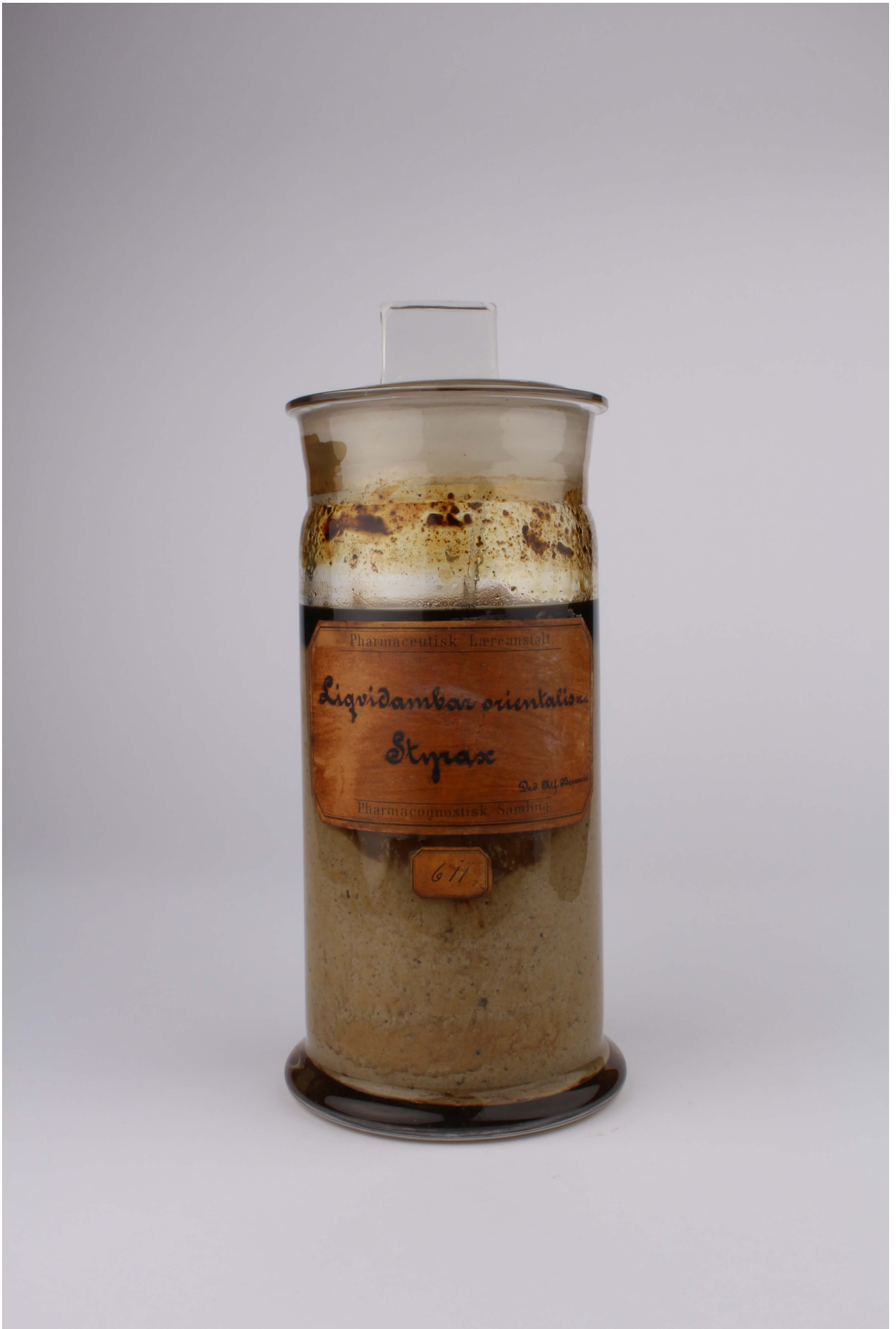
Fig. 4. Liquidambar orientalis - Resin - FS 611.